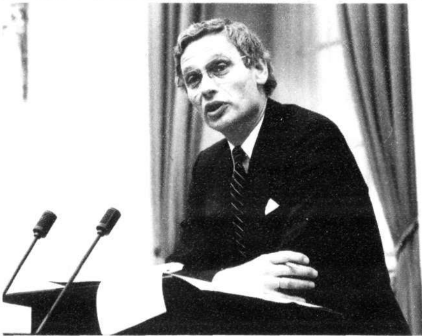
Minister Van den Broek van Buitenlandse Zaken.

kring opgevat als een teken van diepe frustratie van progressieve blanken in Zuid-Afrika over de mogelijkheden van vreedzame verandering.