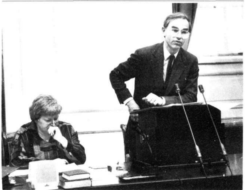
Minister Ruding van Financiën aan het woord. Aan zijn zijde zit staatssecretaris Kappeyne van de Coppello van Sociale Zaken en Werkgelegenheid.

Minister Ruding : Mijnheer de Voorzitter! De ministerraad heeft op 7 februari jongstleden op voorstel van het ministerie van Sociale Zaken en Werkgelegenheid besloten om een interdepartementale werkgroep te laten inventariseren waar en hoe de financiële gevolgen van echtscheiding een rol spelen op de rijksbegroting. Die werkgroep moet de mogelijkheden bezien tot beheersing van de gevolgen van de groei van het aantal scheidingen voor de bijstand en voor andere collectieve uitgaven. De belangrijkste reden om die werkgroep in te stellen is dat aan de verwachte groei in de bijstandsuitgaven die zich in de komende vier jaar zal voordoen en die vooral veroorzaakt wordt door de groei van het aantal echtscheidingen, niet zonder meer voorbij kan worden gegaan.