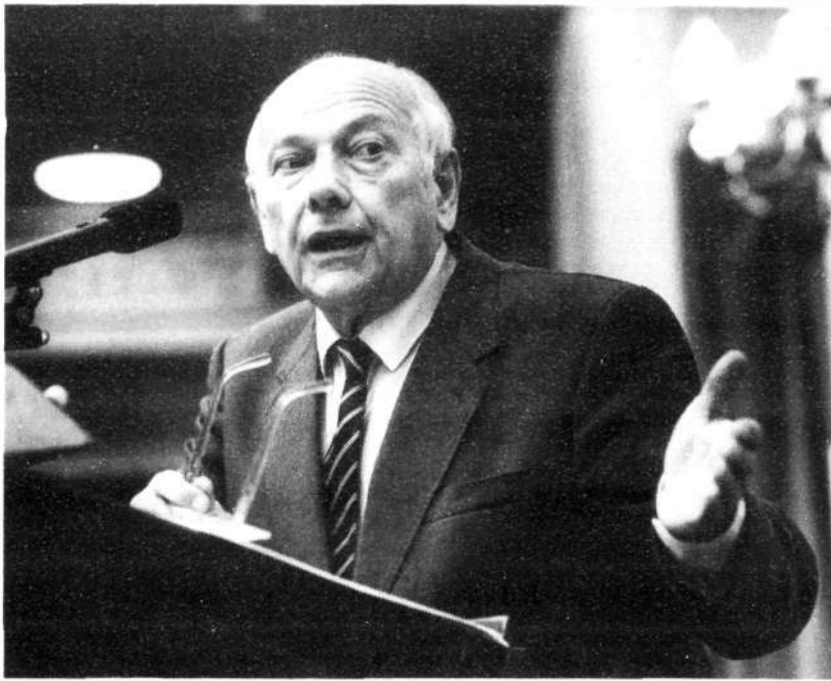
De heer Den Uyl (PvdA).

inzake de kernwapens voor de middellange afstand te behandelen. In dat verband hecht ik er zeer aan, u te vragen of u reeds enige reactie hebt gekregen van de regering op het verzoek dat de heer Ter Beek de vorige week deed – dit verzoek werd onder meer door de heer Voorhoeve ondersteund – om door de regering te worden ingelicht over de huidige stand van de onderhandelingen in Genève. Daarbij zou een oordeel van de regering worden gevoegd.