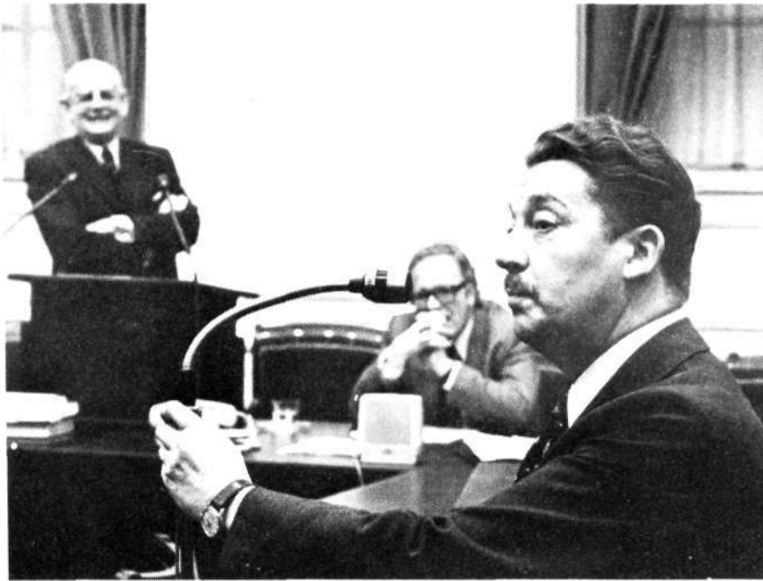
Interruptie van de heer Hermes

geld een ruimere strekking heeft dan alleen voor de onderwijzers.