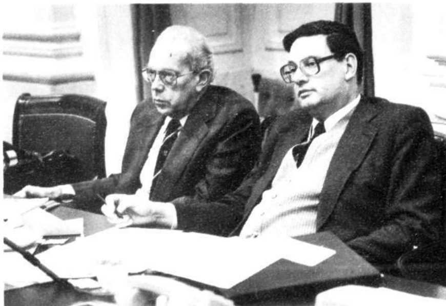
De Bewindslieden Albeda (Sociale Zaken) en Van Aardenne (Economische Zaken)

Uit de vele gegevens die wij van directie en personeel hebben gekregen blijft de indruk over dat de begeleiding van de nieuwe telg in het scheepsbouwgeslacht nu niet bepaald optimaal is geweest. In de brief van de Minister van 19 februari 1981 wordt ingegaan op de oorzaken van die vertragingen. Daarnaast had ik ook gevraagd. In dat verband vraag ik mij toch af, of een soepeler benadering van de afbouw van de incotransschepen dan nu is gebeurd niet meer voor de hand had gelegen.