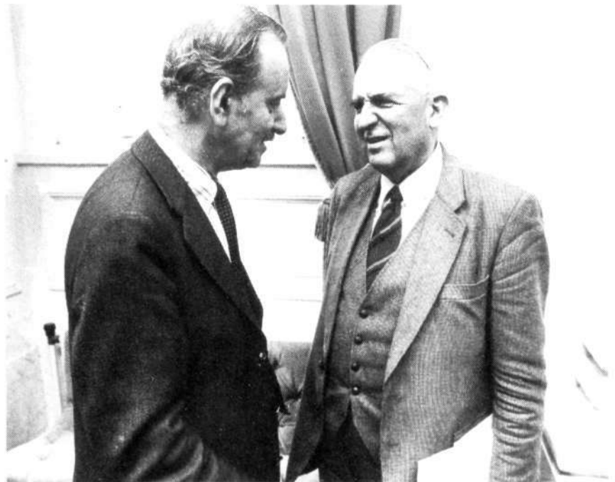
Gesprek tussen Minister Van der Klaauw (Buitenlandse Zaken) en het kamerlid Van Rossum (SGP)