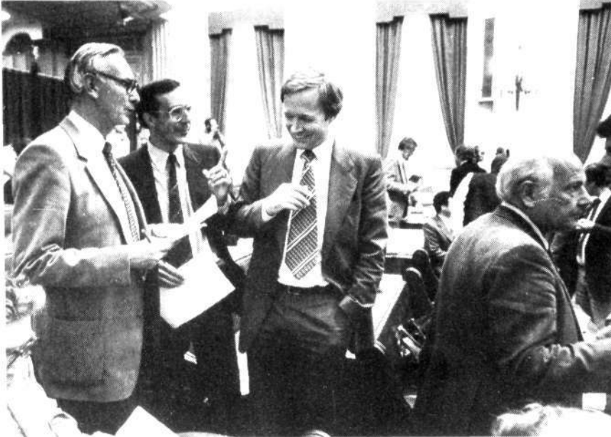
Overleg tijdens de stemmingen over de ingediende moties betreffende de verplaatsing van de ambassade in Israël. V.l.n.r. de kamerleden Van der Stoel (PvdA), Brinkhorst, Terlouw (beiden d'66) en Den Uyl (PvdA)

verhoudingen, die tussen Kamer en Regering behoren te bestaan. Daarom wil ik u een motie voorleggen, mijnheer de Voorzitter.