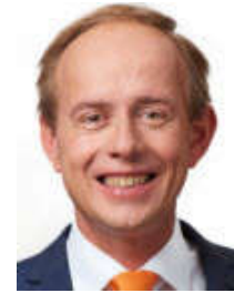
Kees van der Staaij

Een van de twee langstzittende Kamerleden, en fractievoorzitter in de Tweede Kamer.